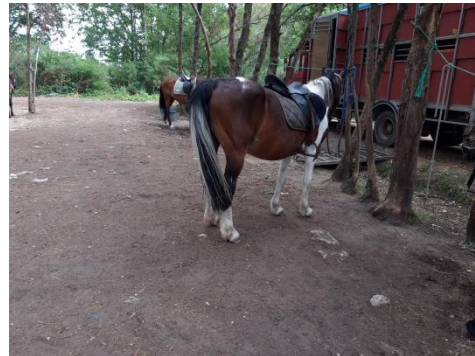
Cookies, le cheval que j'ai monté

L'après-midi, j'ai fait du cheval débutant pendant 1 heure, une balade en pleine campagne. Nous étions un groupe de 7 et j'ai apprécié ce moment comme le meilleur du séjour. Je n'ai qu'une hâte : remonter à cheval.