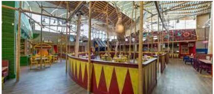
Le restaurant Le marché

Le soir, nous avons mangé au restaurant « Le marché » avec les animateurs qui ont eu la gentillesse de dîner avec nous. C'était buffets à volonté et j'ai très bien mangé : frites-saucisses, fromages traditionnels et glace vanille-chocolat.