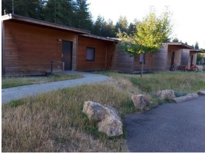
Les petits cottages en bois