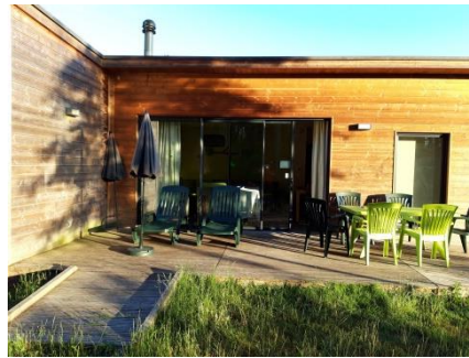
La terrasse extérieure donnant sur le bois