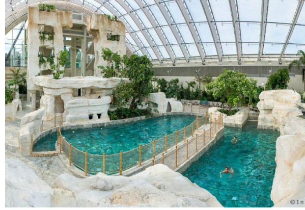
Le bassin pour l'aquagym

J'ai fait une activité aquagym dans un petit bassin. J'ai repris goût pour l'effort et l'animatrice était très gentille.