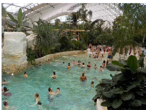
Le bain central pour se baigner

Nous sommes arrivés de la résidence le mardi 7 juin 2022 avec un groupe de 3 femmes et moi. Nous avons commencé par profiter de la piscine et de ses toboggans.