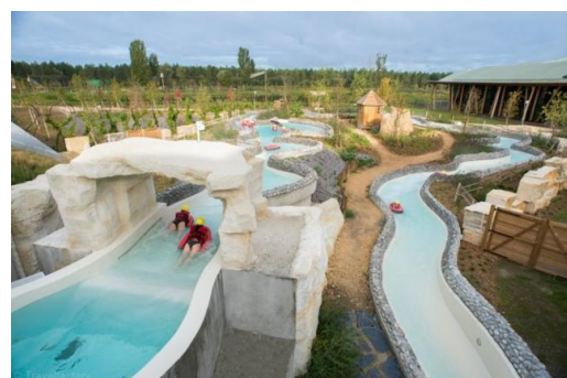
La rivière sauvage que j'ai faite une fois