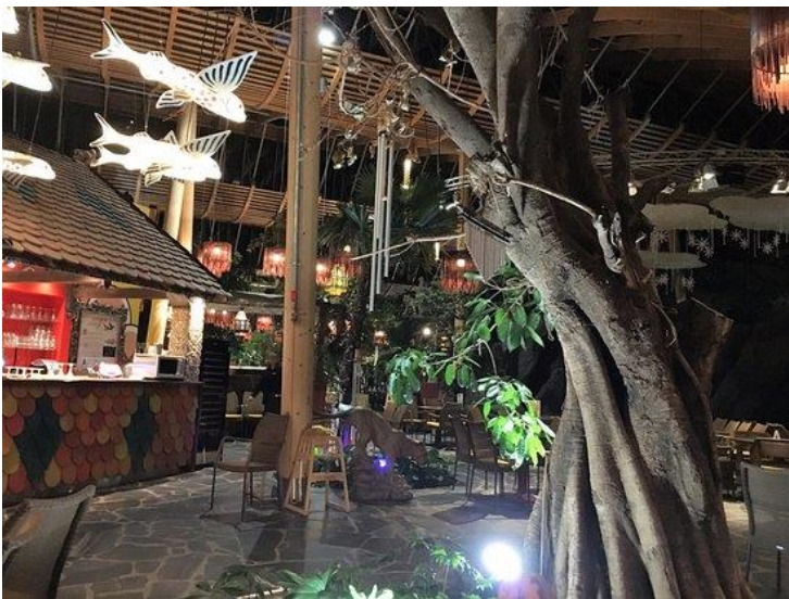
Le cocoon café

Le mercredi 8, nous avons mangé à la crêperie Suzette. J'ai mangé une galette lardons-crème fraîche, pommes de terre, champignons, fromage. En dessert, j'ai pris une crêpe Dame Blanche (glace vanille, coulis de chocolat, amandes grillées, crème chantilly).