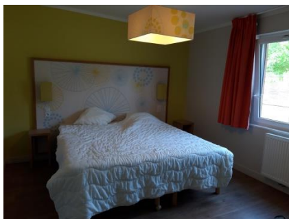
La chambre où j'ai dormis