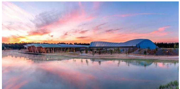
Le Dôme avec la piscine et la place centrale

Après le déjeuner, nous rentrons à la résidence.