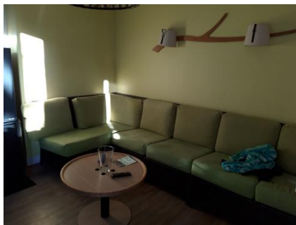
Le salon pour se reposer